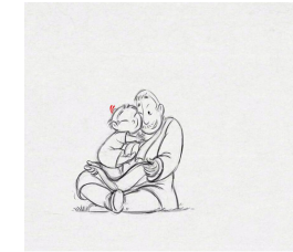
Father and Daughter