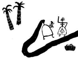
About a Mother