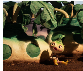
A l'air libre