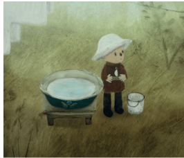
Un jour si blanc