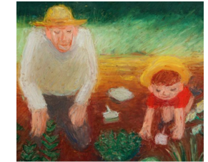
Mon papi s'est caché